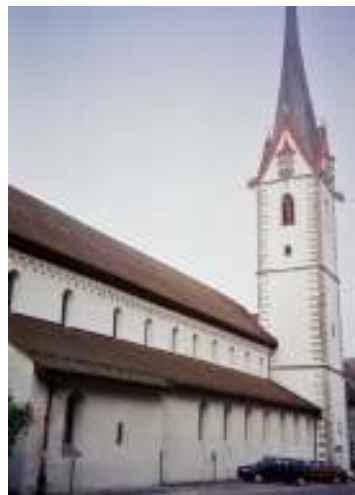
Bシュタイン・アム・ラインのプロテスタント教会