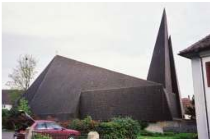
A ヒュットヴィレンの聖フランシスコ教会