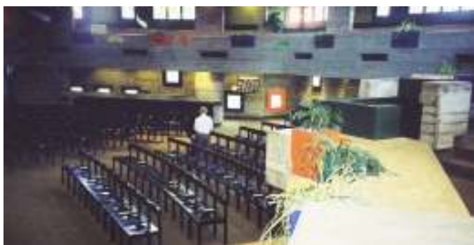
C シャフハウゼンの聖コンラート・センター