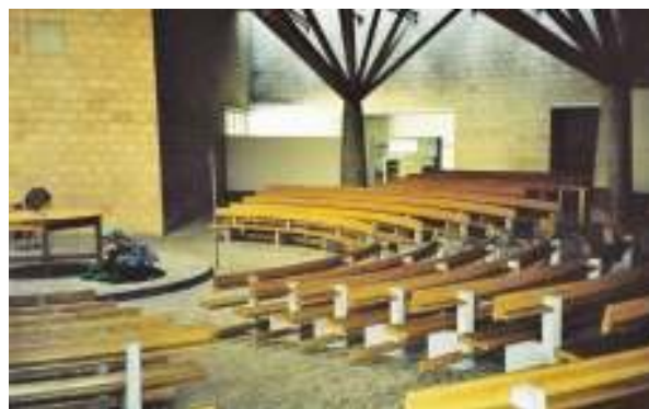
D クローテンのクリストケーニツヒ教会