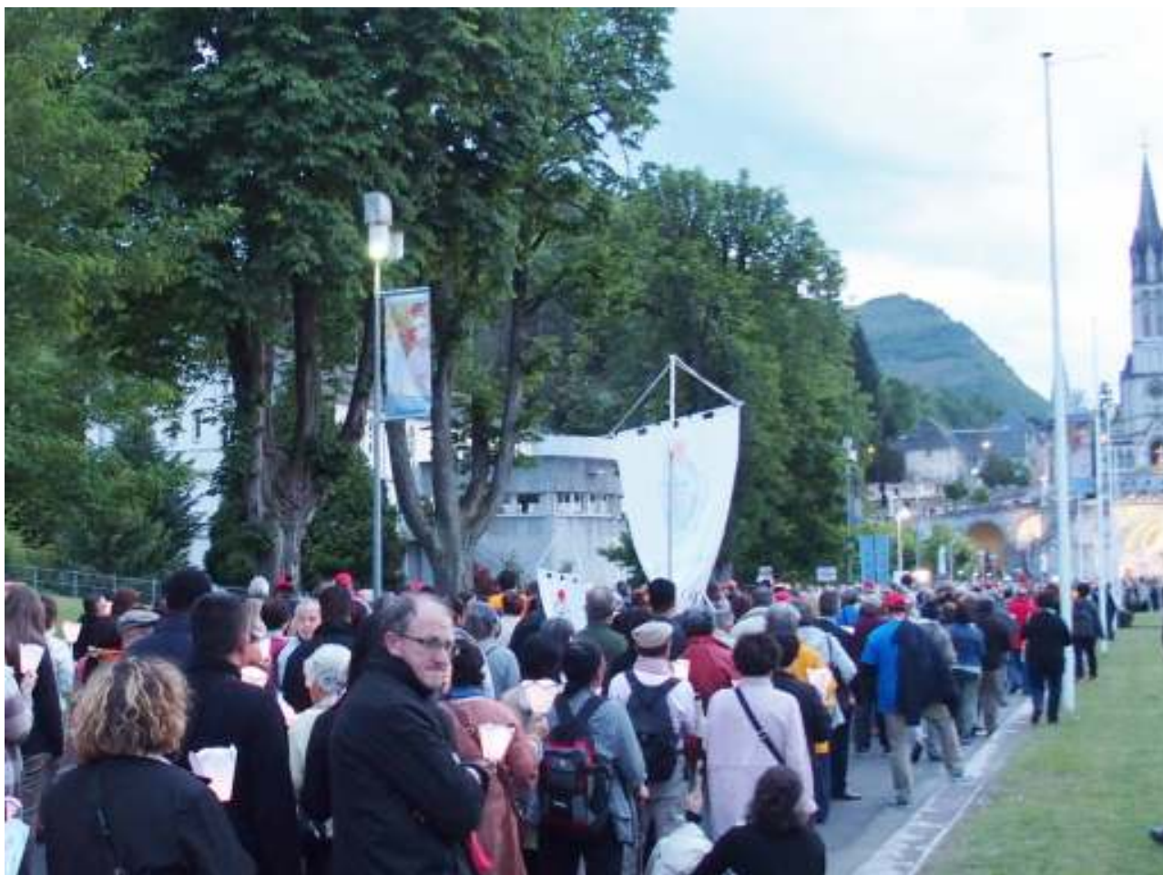
ろうそくを手に、歌いながら聖域を静かに行進する巡礼団