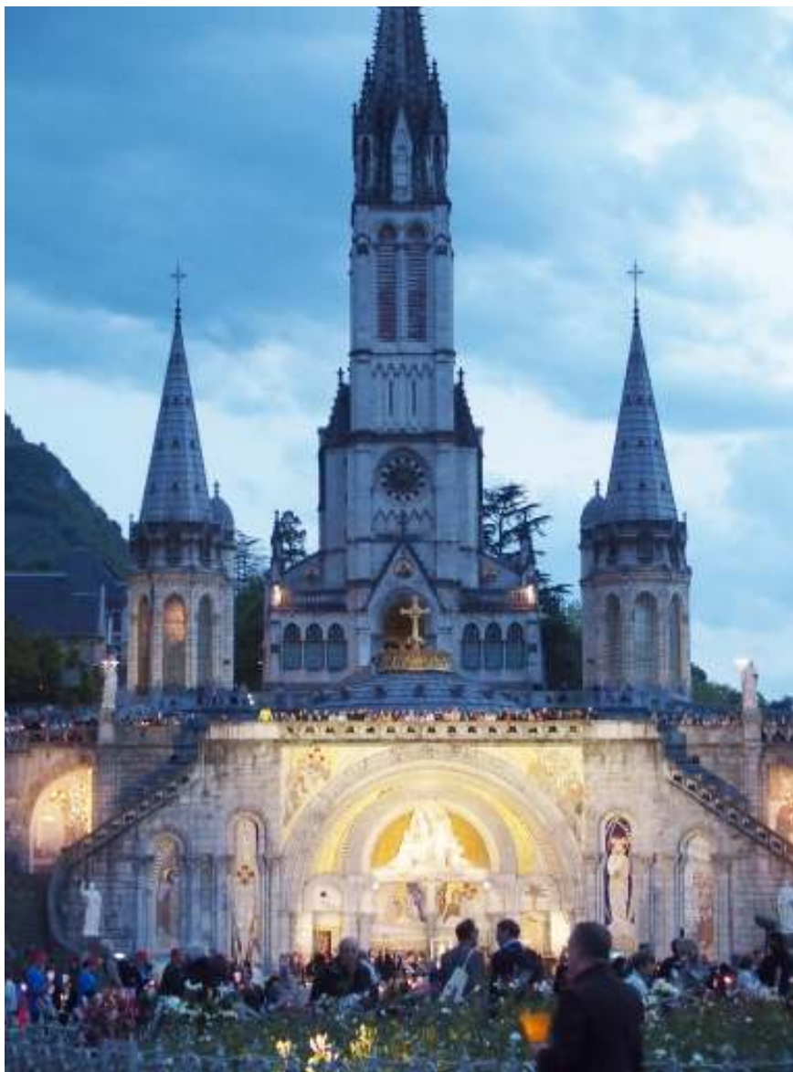
大聖堂 正面ライトアップ