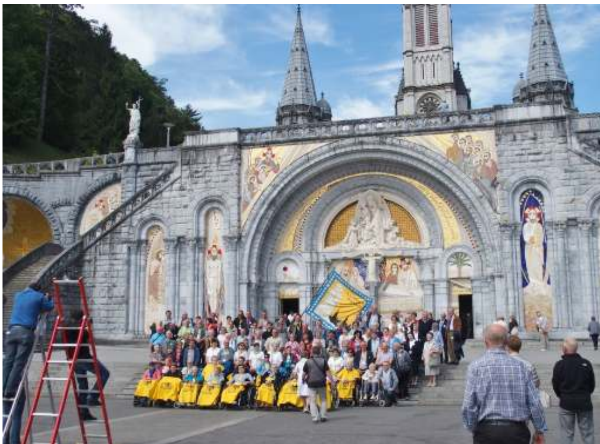
車イスの巡礼団一行は記念撮影、ルルドの水の奇跡を信じ、各国から大勢の巡礼者が訪れる。