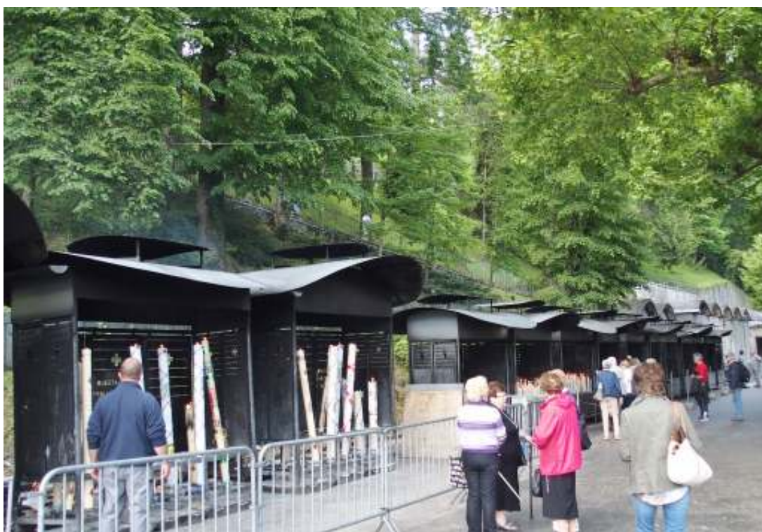
ろうそくを奉納する場所