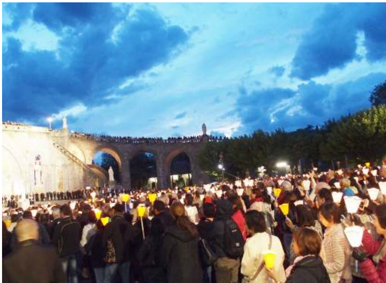
しだいに闇が迫り、ろうそく行列も終盤になると空は濃紺に変化していく。