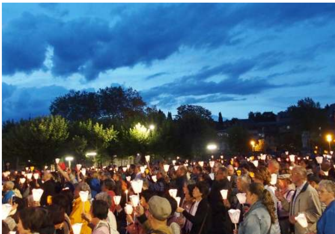
讚美とともに、ろうそくの明かりを高くかかげる