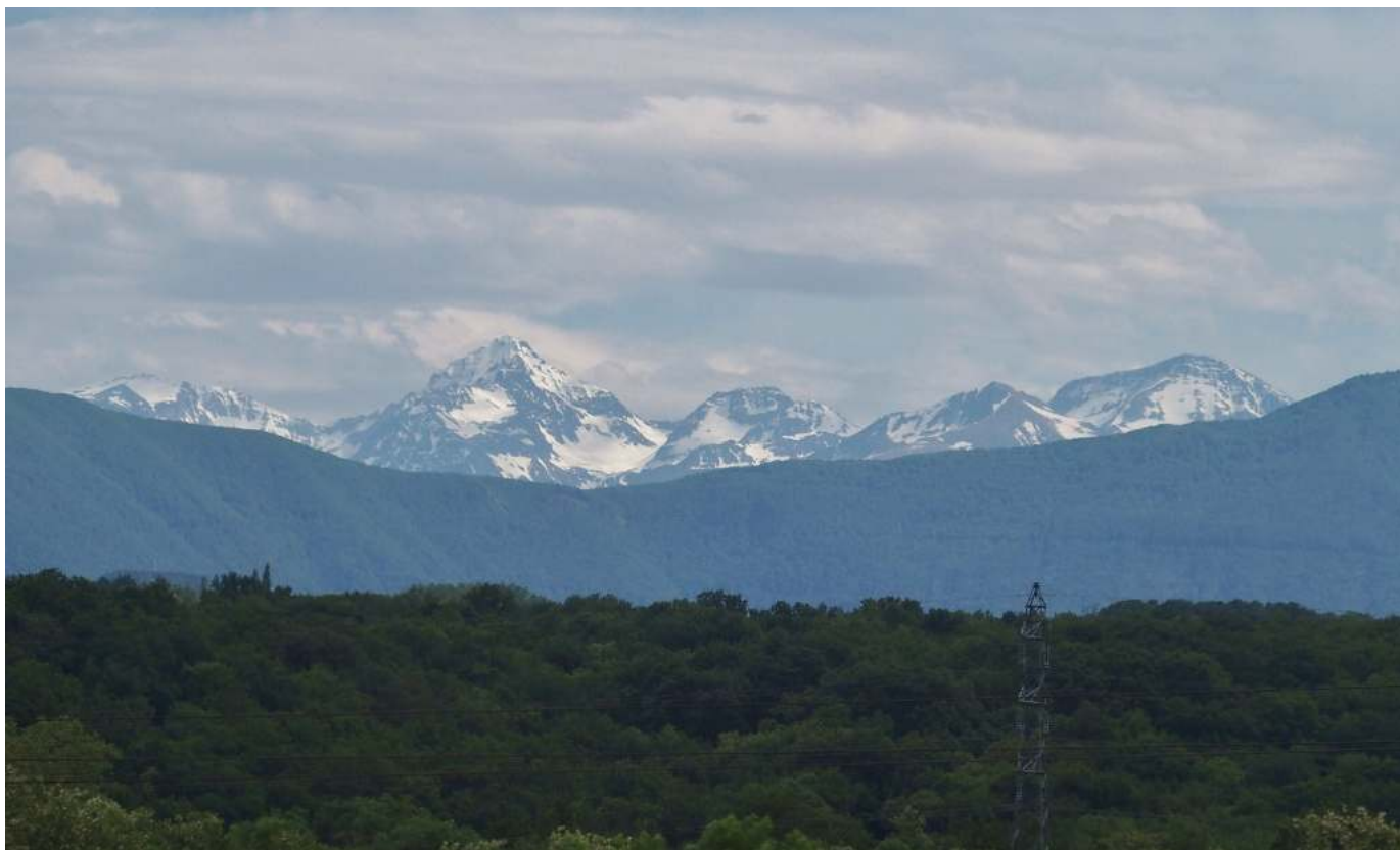
ルルドはスペインとの国境の小さな町、白い雪をかぶった 3000m級のピレネーの山々が美しい。