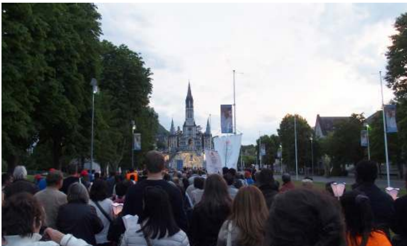
ろうそく行列は9時からスタート。夜9時過ぎでも、まだ明るい5月。