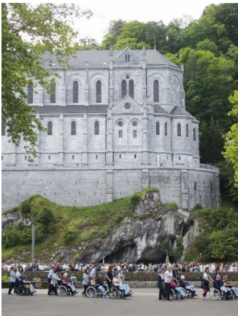
グロット（マサビエルの洞窟）