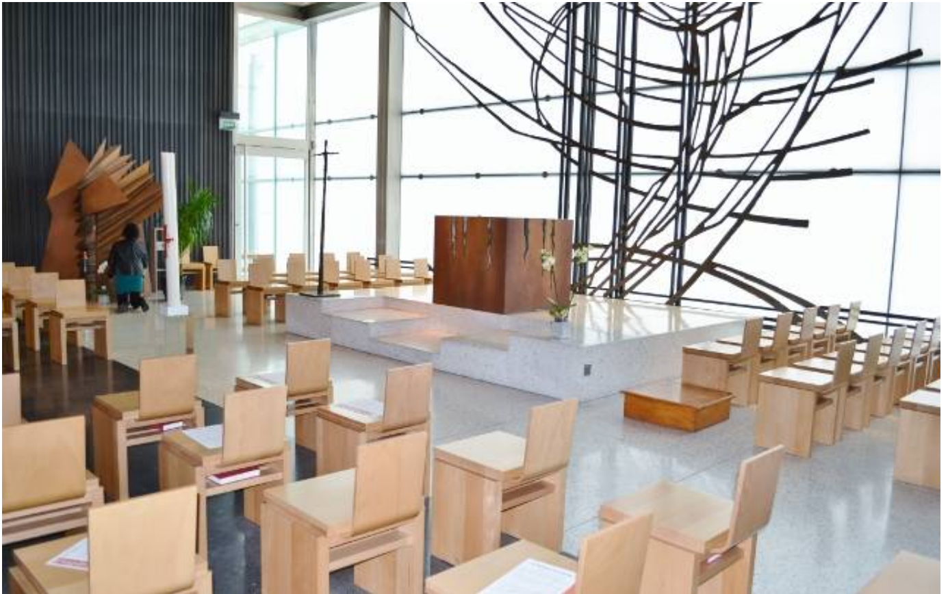
聖壇コーナー正面