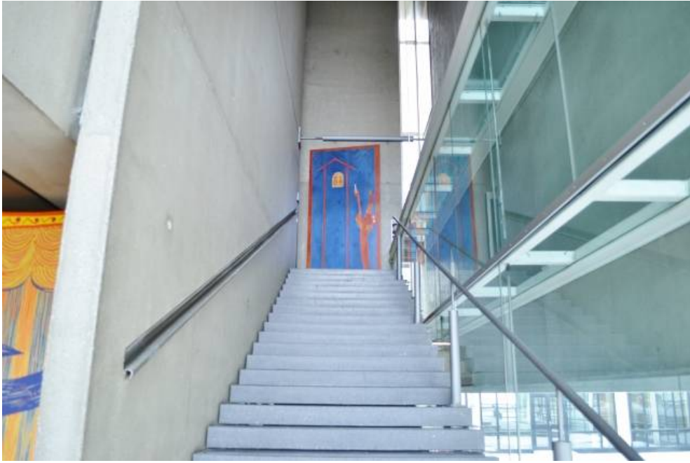
2階礼拝堂への内部階段