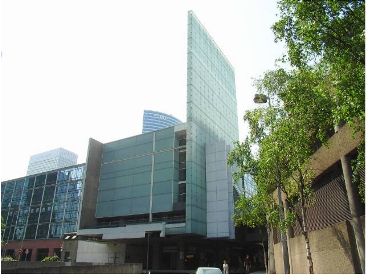
裏側面と外壁部十字架デザイン