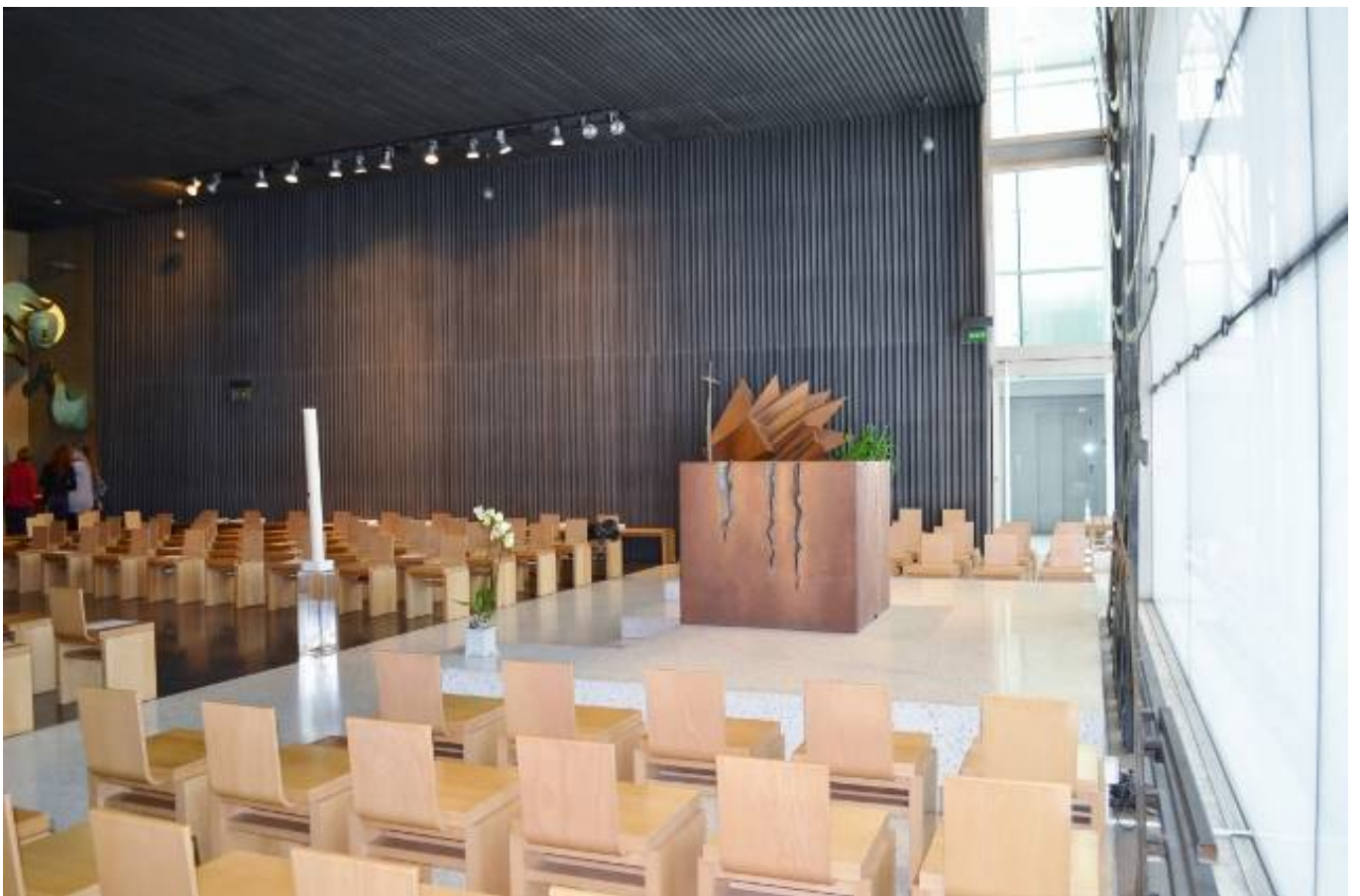
聖壇コーナー側面