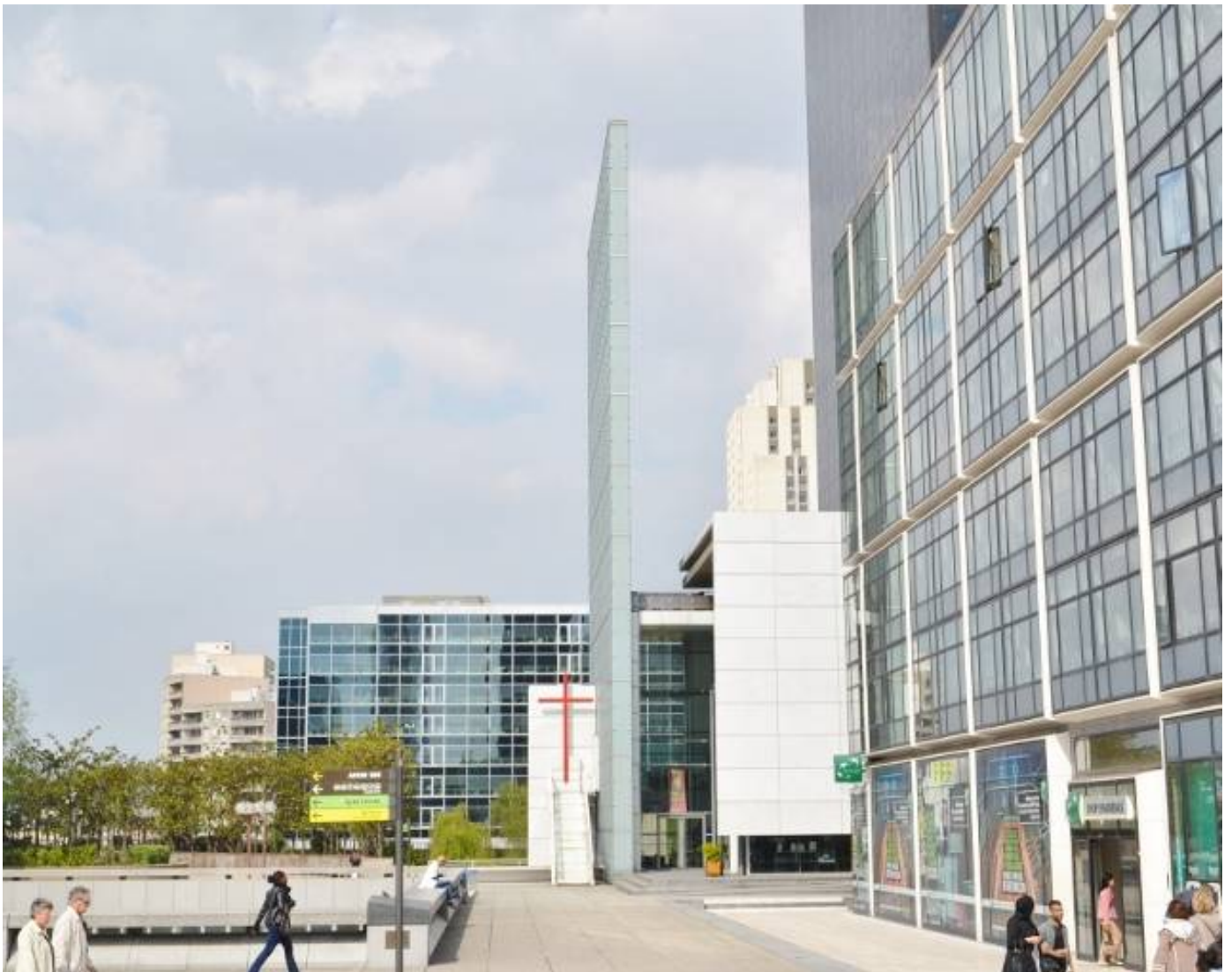
新凱旋門近く 右側奥