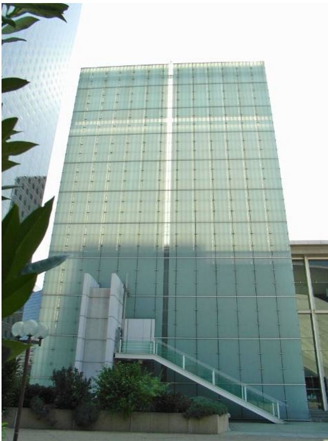
大きなガラスの十字架