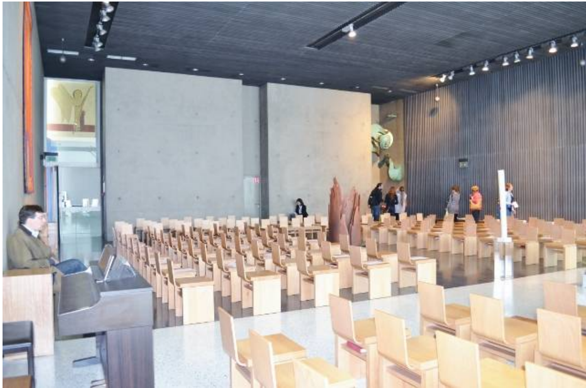
聖壇から背面を見る