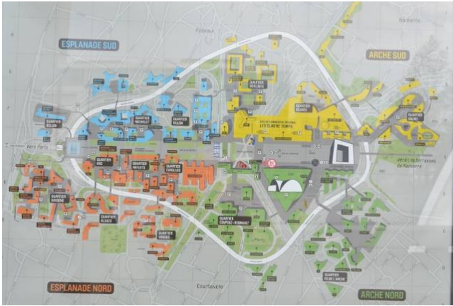
パリ近郊のラ・デファンス地区