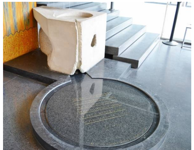
洗礼盤 礼拝堂に通じる階段の登り口にあり、必ず生まれ変わりを確認して礼拝堂に登る。