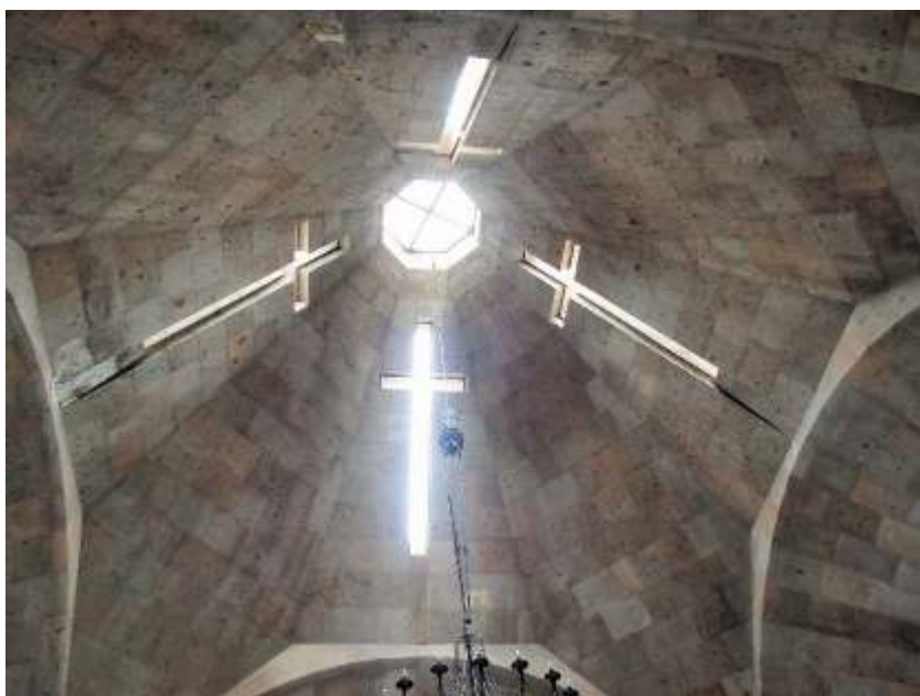
祭壇、十字架、天窓からの光