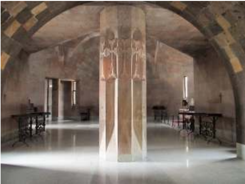
正面入口から洗礼堂を見る