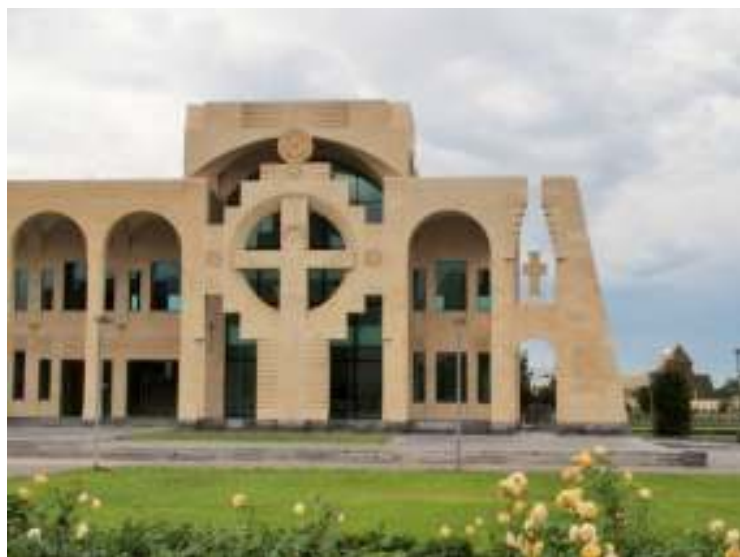
正面右手の十字架

https://www.youtube.com/watch?v=F1kMJzfxrA4