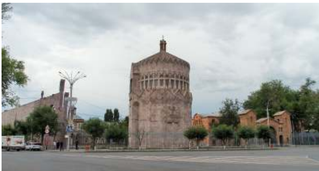
アルメニア正教会総本山エチミアジン大聖堂敷地を大通り交差点から見る