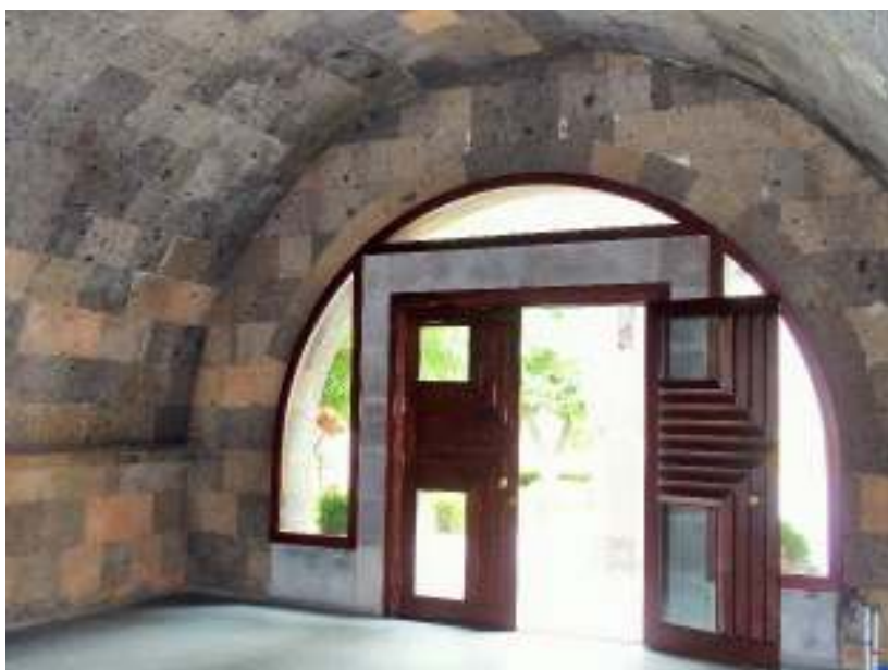
半円形のアーチ、扉のデザイン

https://www.youtube.com/watch?v=20tUP0-JqUk