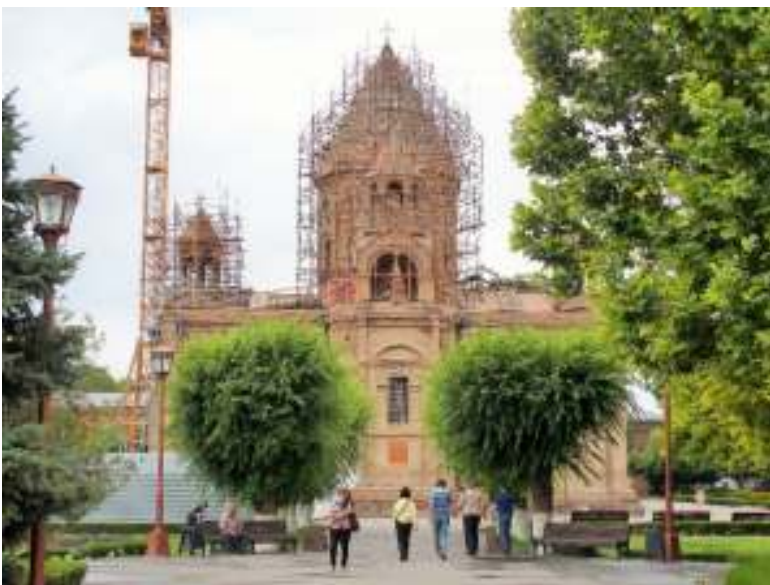
正門から正面大聖堂