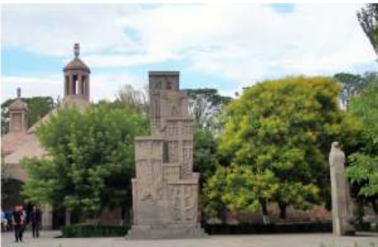
正門から右手の洗礼堂とモニュメント

https://www.youtube.com/watch?v=62Inxf3d7I0