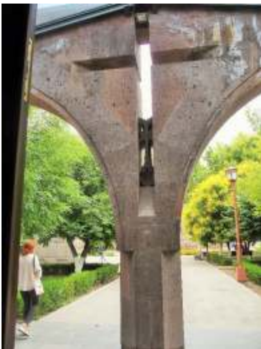
正面入口から外部エントランスを見る