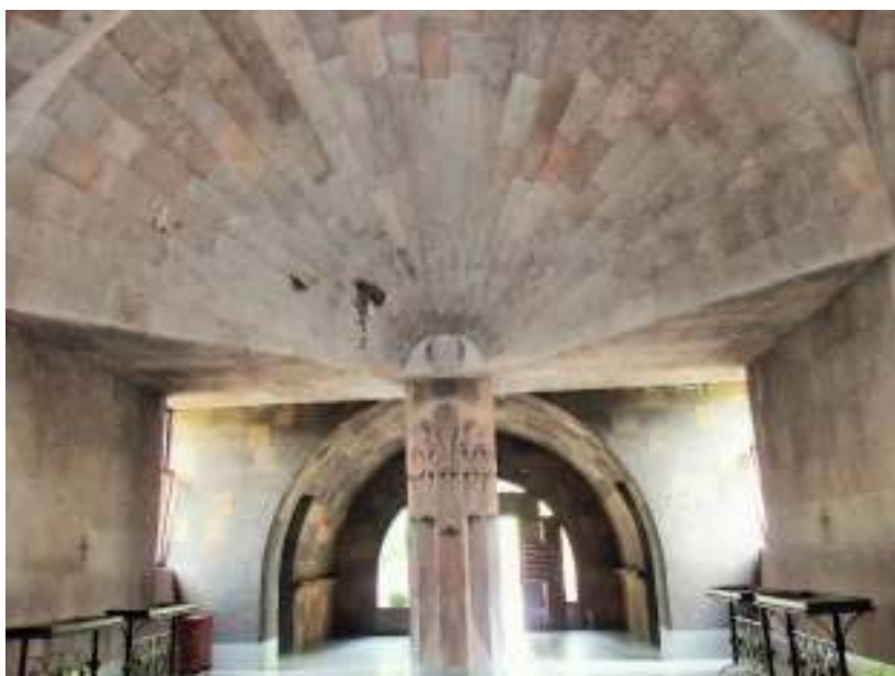
洗礼室から正面入口を見る 天井、壁、円柱、窓のモダンなデザイン